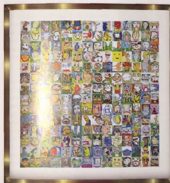
Ohne Titel, 2014, Collage, Filzstifte, Edding, Acryl und Öl auf Papier, 172 x 172 cm